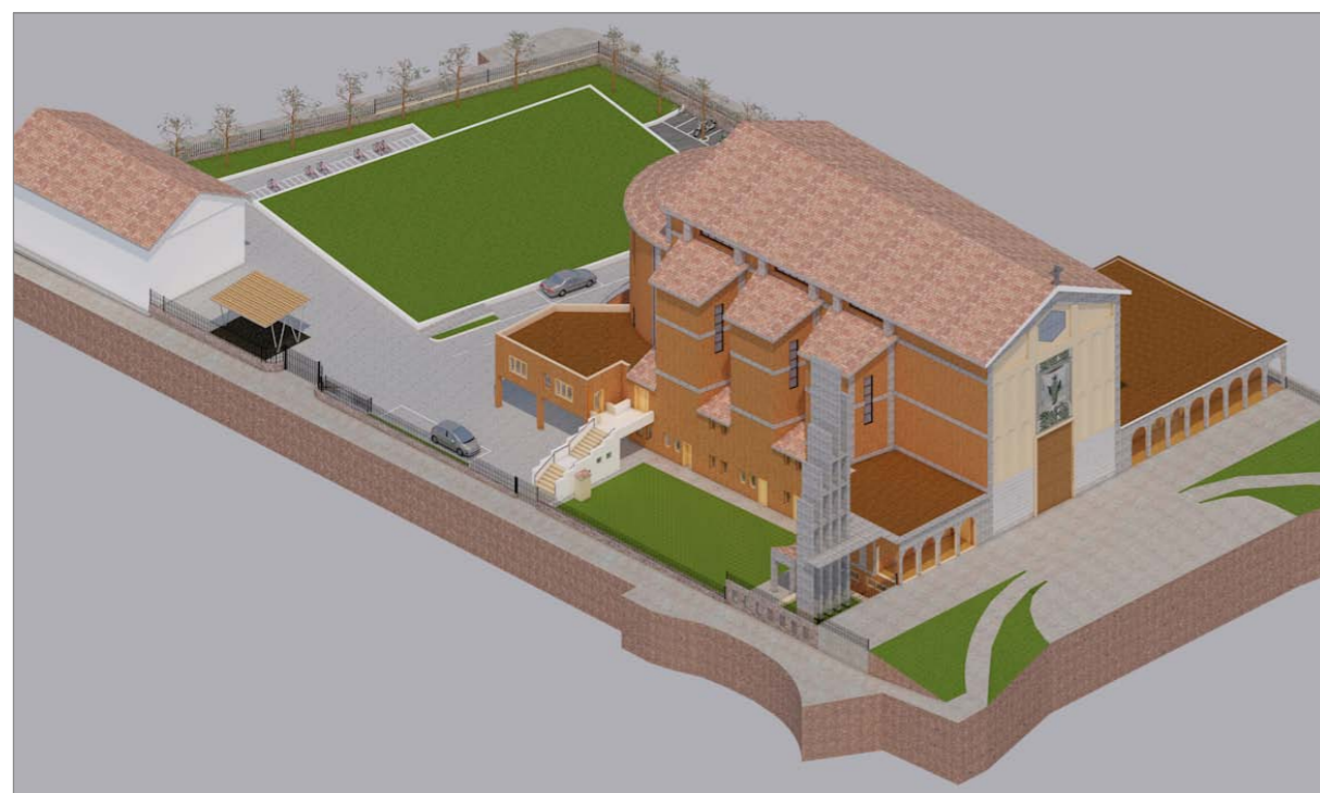
VISTA 3 - Stato futuro