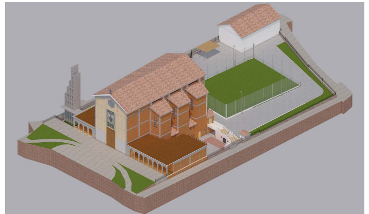
VISTA 4 - Stato attuale