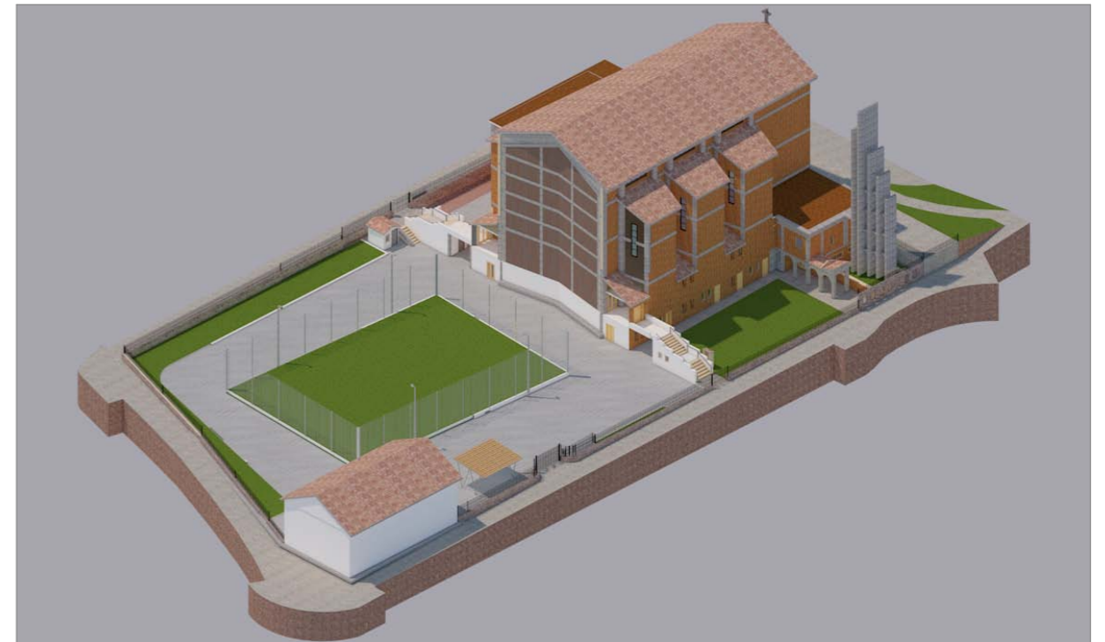
VISTA 2 - Stato attuale