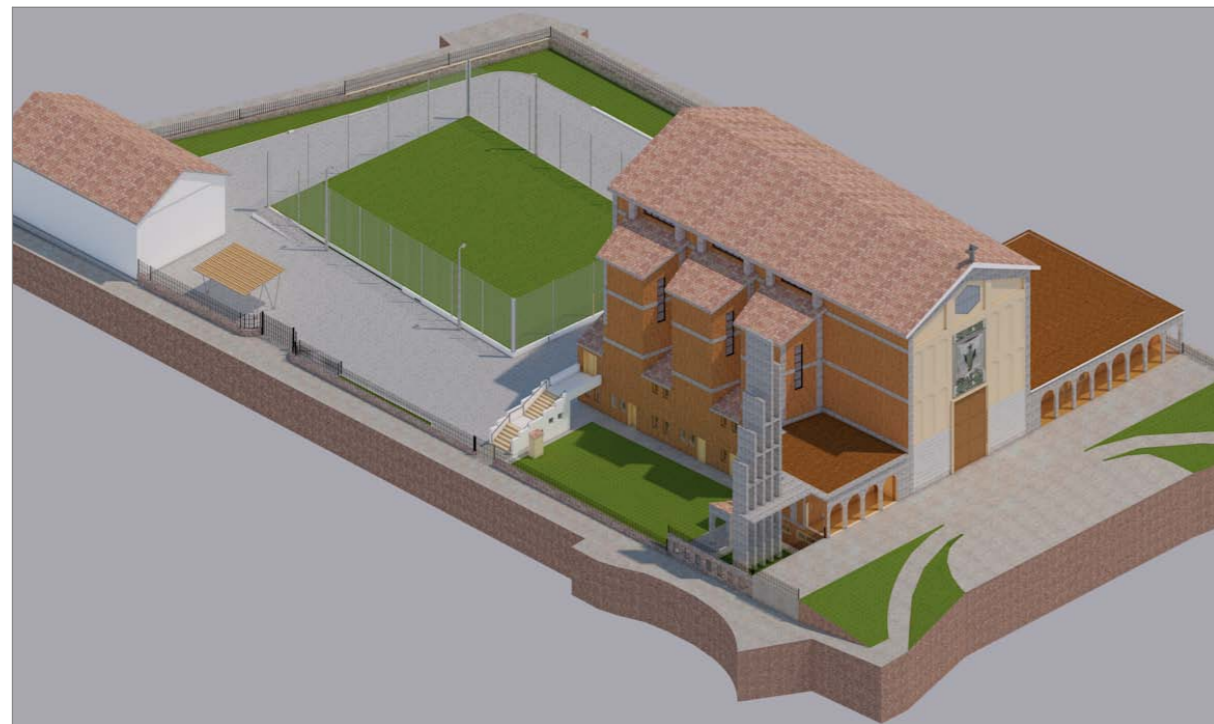
VISTA 3 - Stato attuale