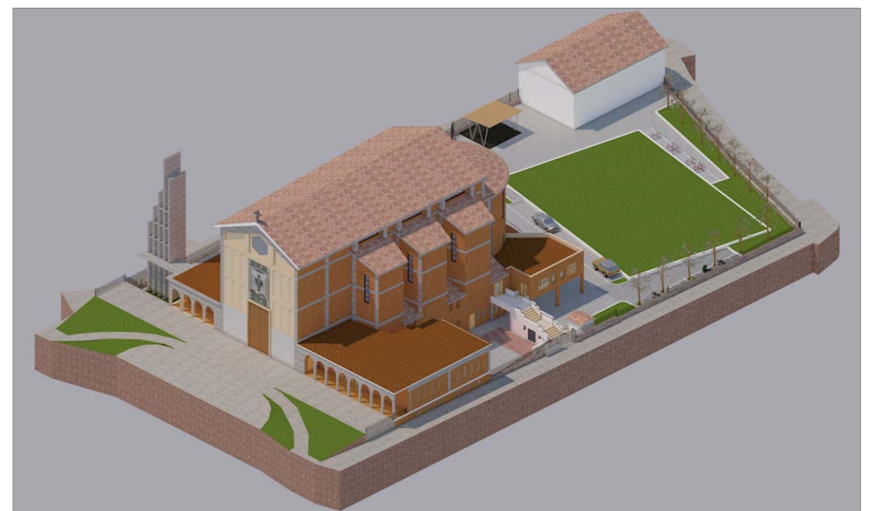
VISTA 4 - Stato futuro