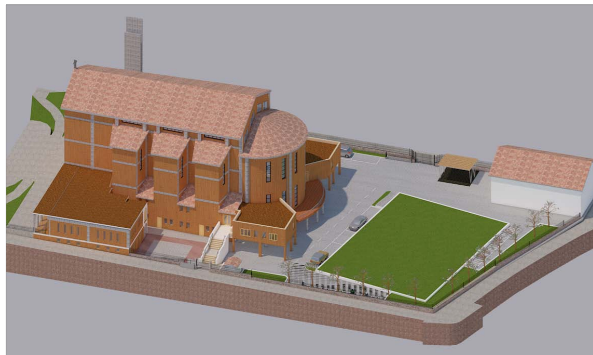
VISTA 1 - Stato futuro