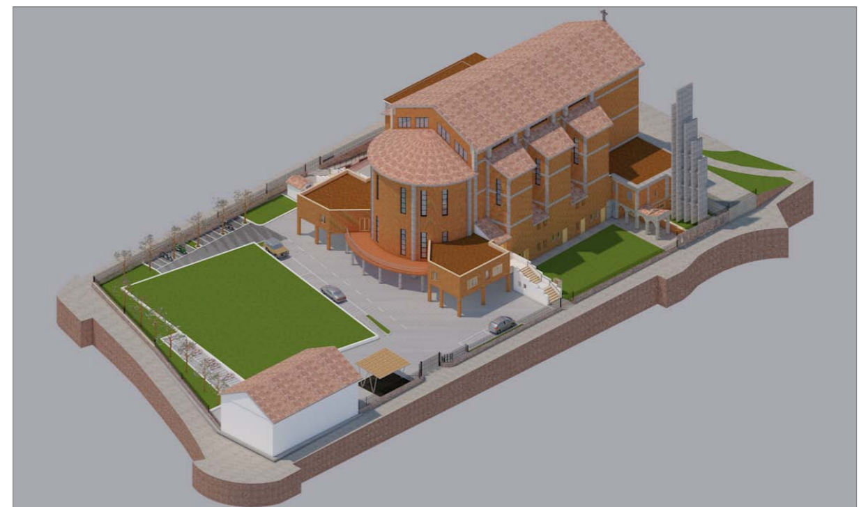
VISTA 2 - Stato futuro