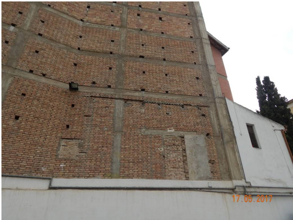
TOMPAGNATURA DA DEMOLIRE (parete non collegata con il telaio dei portali in c.a.)