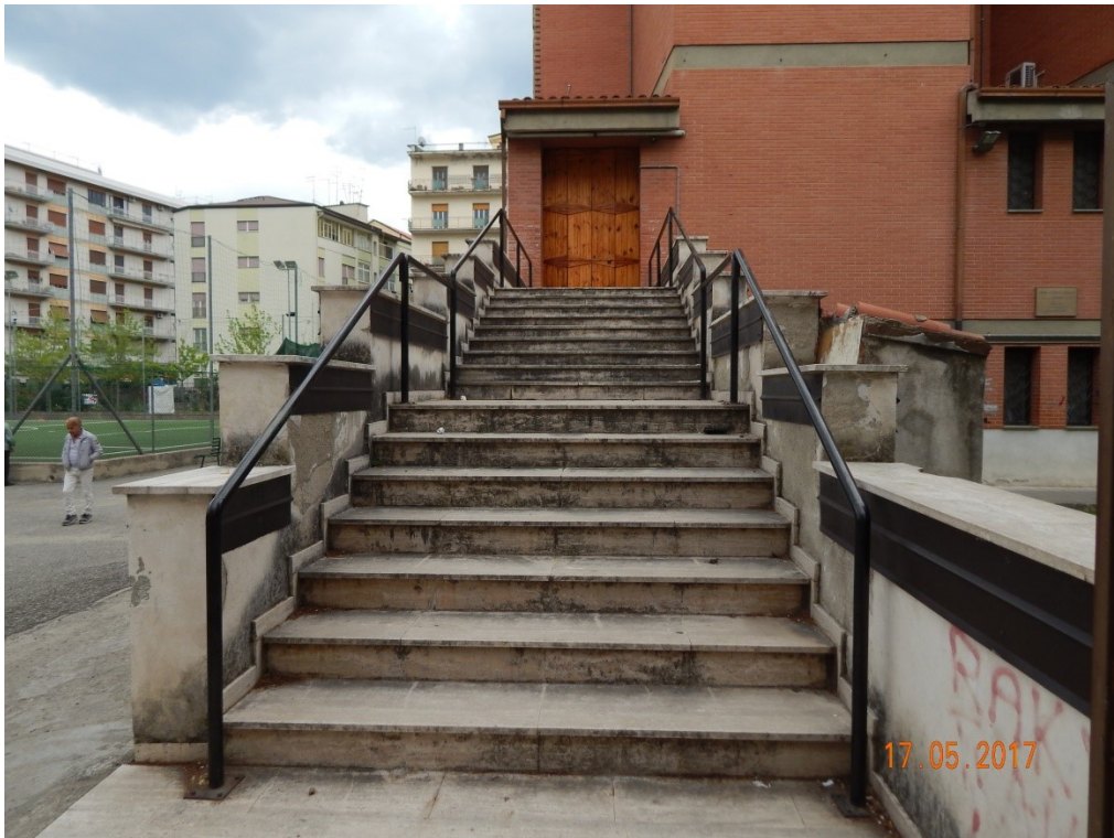
ACCESSO LATO NORD