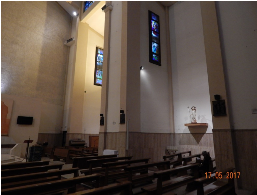
CAPPELLE LATO NORD