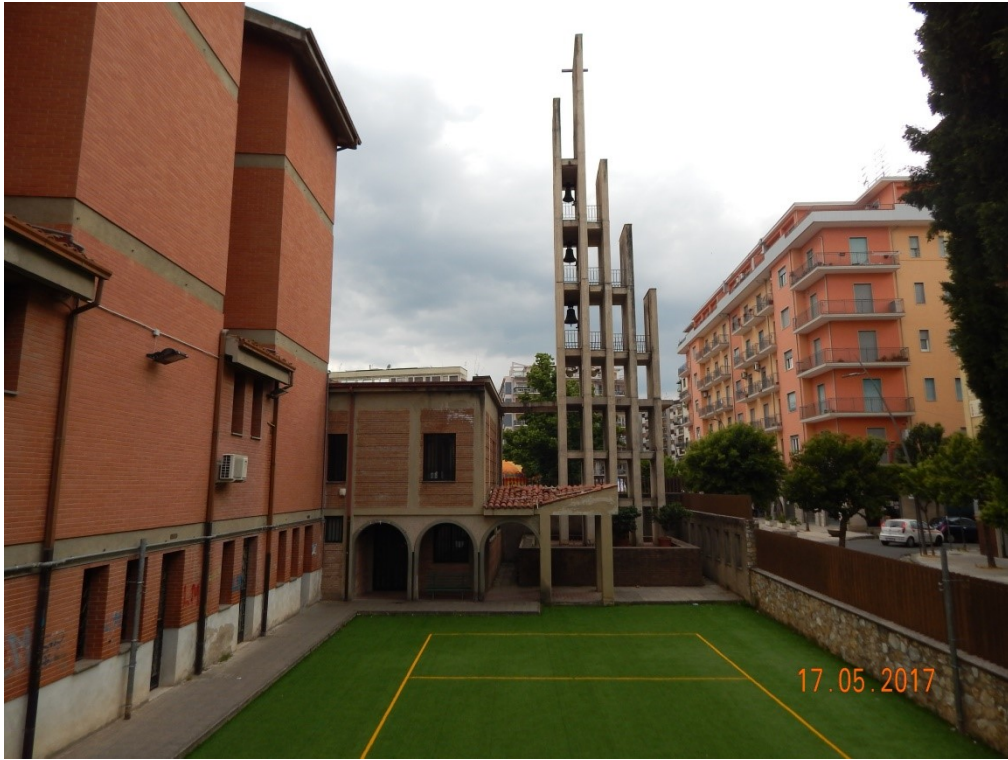
CORTILE LATO NORD – VISTA CAMPANILE