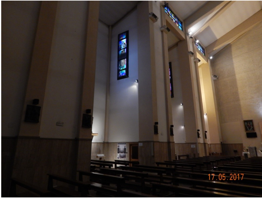
CAPPELLE LATO SUD