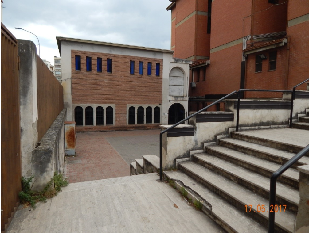
ACCESSO LATO SUD